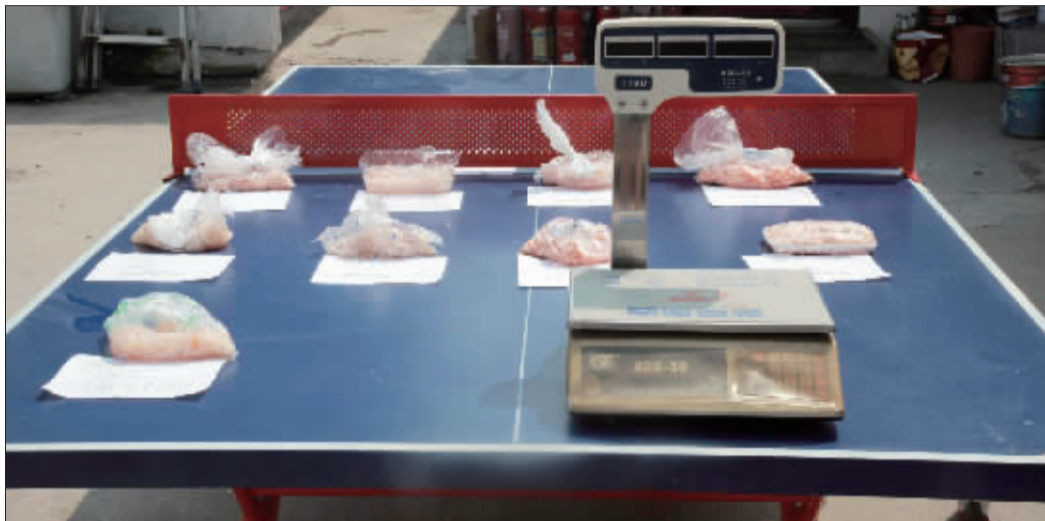
记者在九家连锁超市内购买了冰冻虾仁,并在解冻后对它们进行称重实验