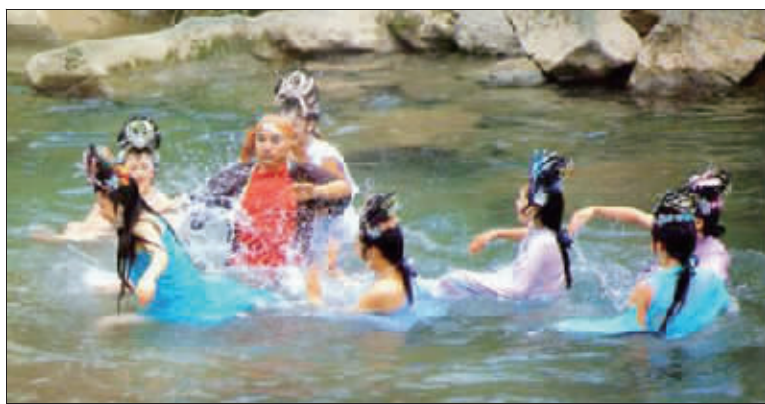
83版《西游记》“八戒水中戏众妖女”这场戏的拍摄地也是在九寨沟

“文革”后,1975年农牧渔业部的一个工作组对九寨沟进行了综合考察,并得出了“九寨沟不仅蕴藏了丰富、珍贵的动植物资源,也是世界上少有的优美风景区”的结论。同年,中国林科院院长、著名的林学家吴中伦教授也对九寨沟进行了全面的考察。自此,九寨沟便从一个默默无闻的林场成了游人如织的世界级风景名胜。