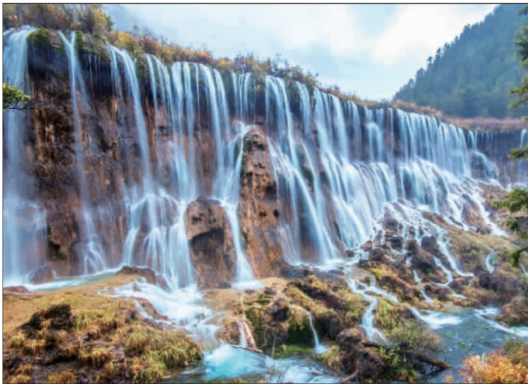
地震前的诺日朗瀑布