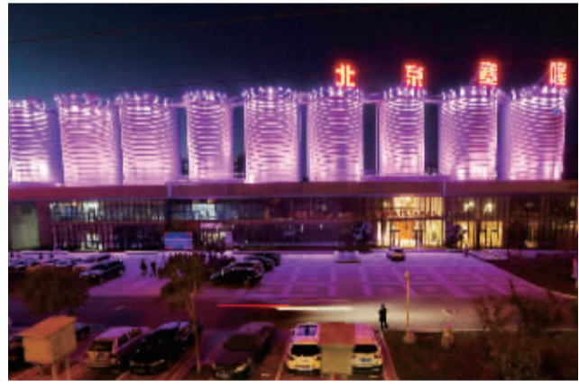
▲北京塞隆国际文创园的46座筒仓在夜间会全部点亮,如今它们已经成为双桥地区的文化新地标