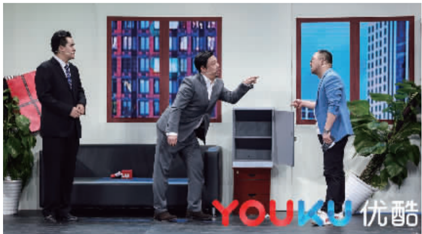
“喜剧老男孩”《笑声传奇》第一季总冠军贾冰