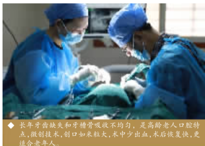
◆ 老年牙齿缺失和牙槽骨吸收不均匀,是高龄老人口腔特点,微创技术,切口如米粒大,术中少出血,术后恢复快,更适合老年人。

“种牙后,老伴一下年轻了二十岁,这只是外表的变化,老伴的智商也在不断恢复……”这是一封患者家属写来的感谢信,信中写道:“由于牙齿脱落,长期营养不良导致大脑受损。身为高级教师的老伴填写表格时,想不起字咋写而无法胜任了,行动也变得迟缓,神态也变得呆滞。到医院安了满口假牙不管用,一咳嗽咀嚼食物假牙就掉下来了。”