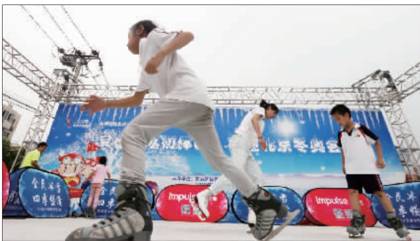
小朋友在仿真冰场玩耍

“我们和专业厂商洽谈,厂商免费为我们在东四块玉文化广场搭建了52平方米的仿真冰场,受到了居民尤其是小朋友们的欢迎,报名体验通道开启后,这个项目的报名人数最