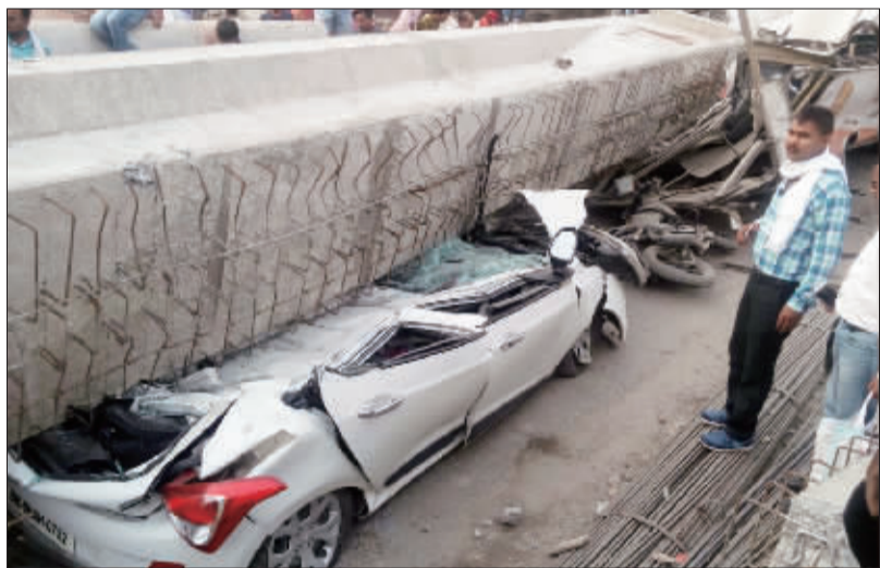
15 日,印度一在建立立交桥垮塌,一些车辆被砸中

2014 年 3 月 16 日,克里米亚和塞瓦斯托波尔市举行全民公投,超过九成投票者同意脱离乌克兰、加入俄罗斯。18 日,普京与两地代表签署条约,允许克里米亚和塞瓦斯托波尔以联邦主体身份加入俄罗斯联邦。乌克兰不承认上述公投,反对克里米亚和塞瓦斯托波尔市并入俄罗斯,西方因此对俄实施经济制裁。