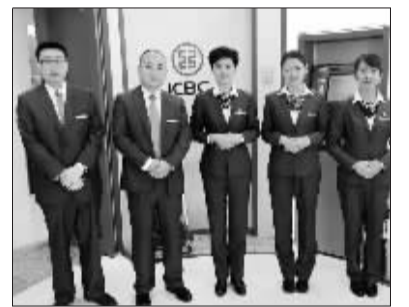
工行北京新航站楼网点支行员工

水流大地,润物无声。新航站楼支行在做好银行业务服务的同时,还发挥助人为乐的精神,为客户提供旅游交通等各方面咨询服务,为旅客点