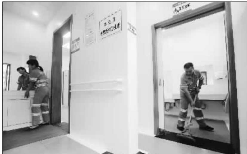
位于雍和宫大街22号旁的一类公厕，增设了第三空间，内设婴儿打理台、婴儿椅等