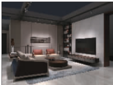
百强家具2018年坤伦系列

百强家具在第42届中国（上海）国际家具博览会上推出“坤伦”现代中式系列，采用国际流行时尚设计风格，融入东方意蕴的元素，使空间更具表现力，灵动且更具现代感。作为百强家具2018年上市的新品，坤伦系列采用多种元素进行融合：材质上，以实木、皮革和金属相结合，彰显现代时尚；色彩运用上，色调深浅搭配，稳重且不失变化；同时运用各种精妙的空间处理和软装搭配打造一体化生活空间场景，满足大众对风格一体化、家居多元化的审美需求，为追求舒适与优雅的现代人，塑造一种极具现代时尚的生活体验方式。