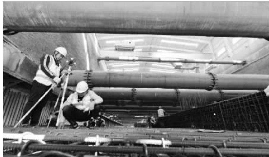
地铁19号线一期工程积水潭站至北太平庄站区间暗挖段顺利下穿地铁2号线

记者从北京市轨道交通建设管理有限公司了解到,19号线南北横穿北京老城区,风险数量多且级别高,共有风险源1380处,其中特一级风险源占比高达32.7%。积水潭站至北太平庄站区间暗挖段有特级风险源1处,便是下穿既有2号线。新建19号线积水潭站至北太平庄站区间上侧、右侧零距离密贴下穿既有2号线积水潭站至西直门站区