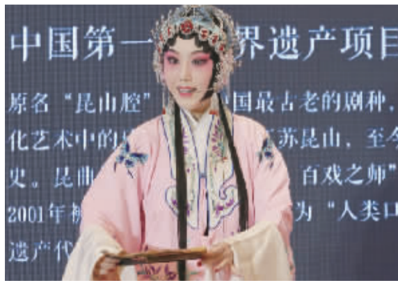
中国最古老的剧种昆曲