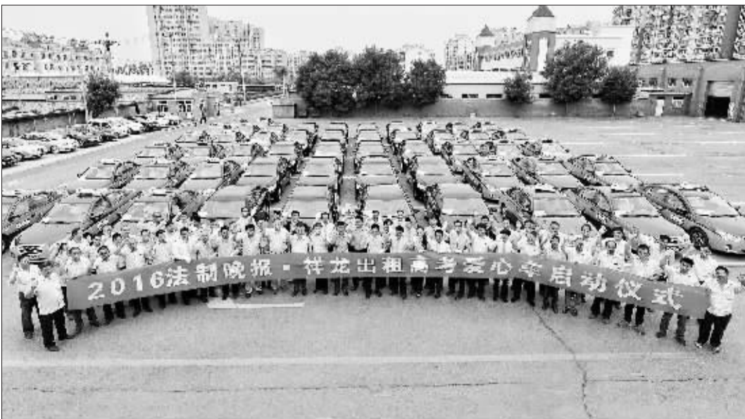
上午，“高考爱心车”活动在祥龙公司正式启动