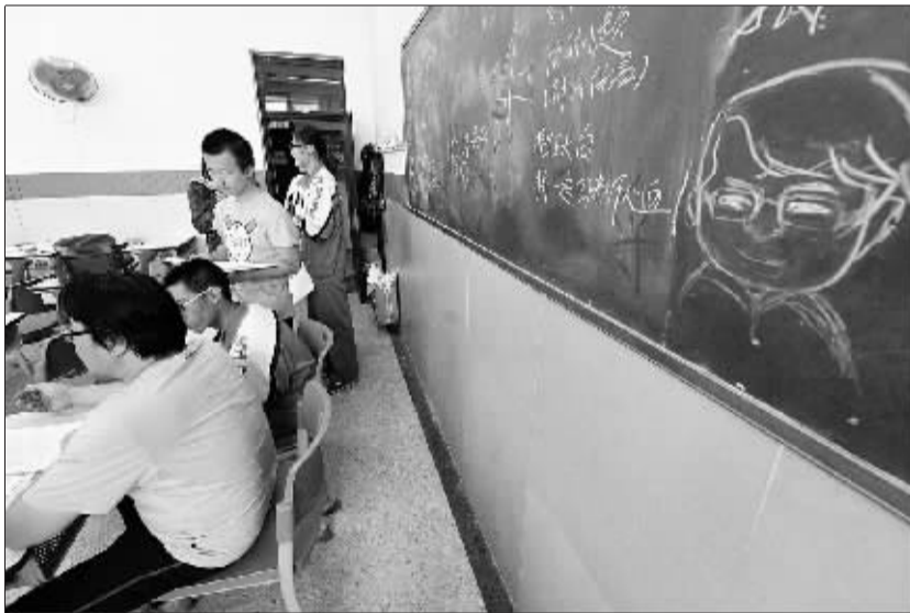
在班级黑板报的右下角写着“抱住大白，捋一遍田老师的心血。”的字样

高考将至，爱心起航！今天上午 9 时，由法制晚报社与北京祥龙出租车有限公司联合推出的“高考爱心车”，在祥龙公司举行启动